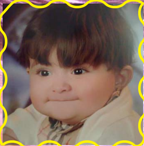
الأميرة الصغيرة فجر بنت أحمد بن عبدالرحمن السليم